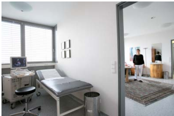
Blick in das Untersuchungszimmer für die Farbdopplerechokardiographie und das Arztzimmer